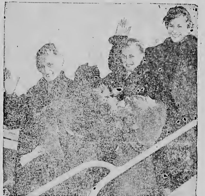
PRINSES MARTHA VAN NORWEGEN brengt met haar dochters Rughild en Astrid een korte vakantie door in Miami. Boven: de aankomst op het vliegveld Idlewild bij New York.